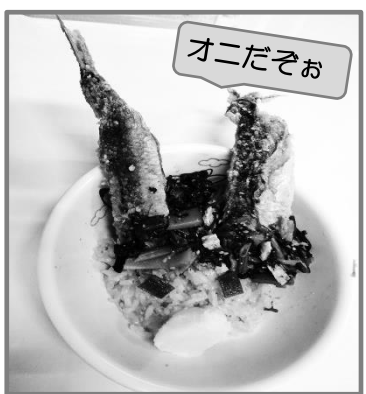
(記事担当) 明浄保育園

あのね そのねっ (*^-^*) 2月といえば節分! 節分は「みんなが健康で幸せに過ごせますように・・・」と願いを込め、豆を投げて悪いもの(鬼)を追い出す日でもあります。豆まきをするのは、「魔物を滅する=魔滅」という説から来ています。匂いの強い、焼いたいわしとひいらぎを玄関に飾る風習もあるようです。また、恵方巻を食べる習慣は関西地方が発祥とされ、その年の恵方を向いて、太巻き一本を無言で食べるのが習わしだそうです。今年の恵方は「南南東」☆お家のなかで小さなお子さんが豆を投げる場合は、誤食を防ぐ観点から、新聞紙などを丸めたもので豆を作って楽しむ方法もありますよ! 右の写真は、明浄保育園の給食「いわしのツノの鬼」です。楽しい遊びや食べるもので、悪いものを追い払いましょうね!!